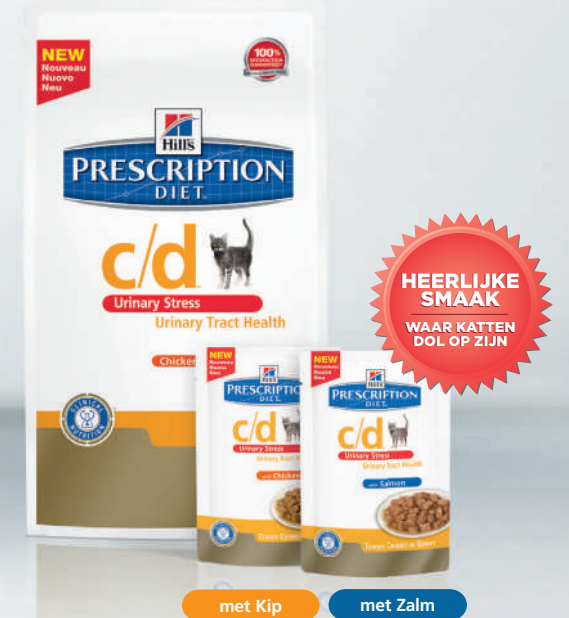
met Kip met Zalm